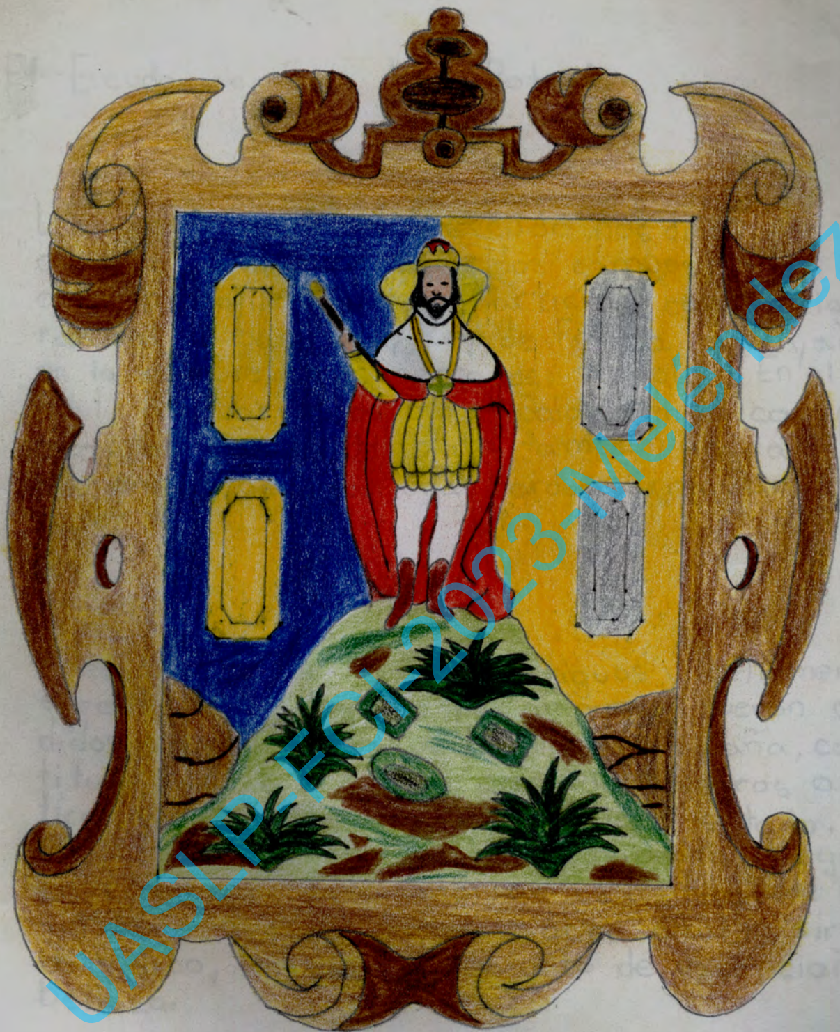
ESCUDO DE SAN LUIS POTOSÍ