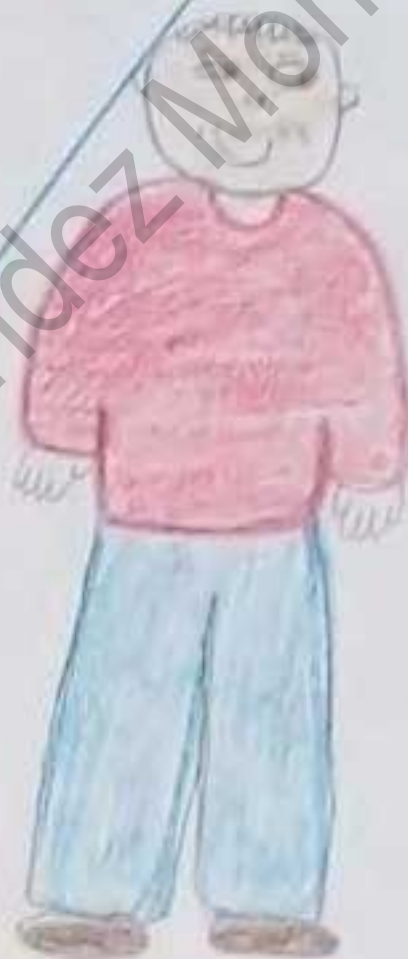
Adole - cente